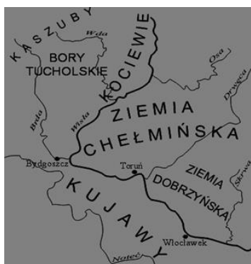
Rys.: Krainy historyczne.

Obszar „Stowarzyszenia Lokalna Grupa Działania Gmin Dobrzyńskich Region Północ” znajduje się na terenie regionu historyczno-geograficznego Ziemi Dobrzyńskiej, we wschodniej części województwa Kujawsko-Pomorskiego. Ze względu na lokalizację posiada on pewne specyficzne uwarunkowania, m.in. w postaci licznych zasobów historyczno-kulturowych, predysponujących go do rozwoju szeroko rozumianej turystyki. Powiat rypiński należy do najstarszych jednostek samorządowych w kraju. Pierwsze wzmianki o powiecie pochodzą już z XIV w., natomiast Kasztelania Rypińska datowana jest od XI w. Prawa miejskie Rypin otrzymał w roku 1345. Wydarzenia historyczne, mające miejsce na tym obszarze ukształtowały jednocześnie tożsamość i odrębność kulturową tego terenu oraz zamieszkujących go ludzi, czego przejawem są m.in. strój dobrzyński i liczne lokalne zespoły pieśni i tańca.